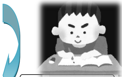
進路相談・親支援